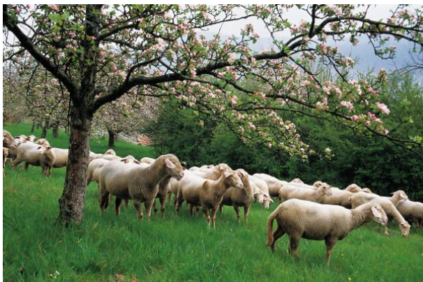
skot a ovce