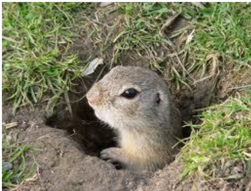
hraboši a syslové